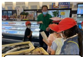
「スーパーよしだ」の見学で身近なスーパーマーケットの工夫が分かりました(3年生)。