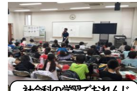
社会科の学習でおれんじ鉄道を使い「エコリア北薩」に行きました(4年生)。