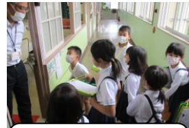
1年生を案内して「学校たんけん」を行いました。上手な説明でした(2年生)。