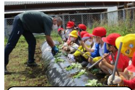
小田農園の方に来ていただき「船底植え」で、いも苗を植えました(1年生)。

5月から6月にかけて、各学年、様々な学習を行いました。地域や人材から学び、 体験したことは、教室の中での学習よりも印象的に学びの成果として残る と思います。これからも各学級の週報等で子供たちの学習の様子が伝えられると思いますので、週末を楽しみにお待ちください。