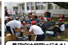
集団宿泊学習に行きました。協力と優しい姿勢が見られ立派でした(5年生)。