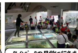
クインパークの見学に行きました。説明と展示が分かりやすかったです(6年生)。