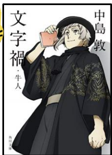
文字禍・牛人 著者：中島敦

アッシリアにある世界最古の図書館には、毎夜文字の精霊が出るという。文字に支配される人間を寓話的に描いた「文字禍」をはじめ、「狐憑」「木乃伊」「虎狩」等人間の普遍を指摘した著者の傑作6篇を収録。