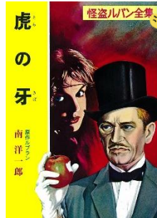
怪盗ルパン 虎の牙 原作：ルパン / 文：南洋一郎

五千の少兵を率い、十万の匈奴と戦った李陵。捕虜となった彼を司馬遷は一人弁護するが…。 中傷による悲運を描いた「李陵」、人食い虎に化身する苦悩を描く「山月記」など、中国古典を題材にとった代表作六編。