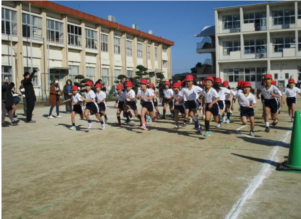
↑ 2年女子のスタート