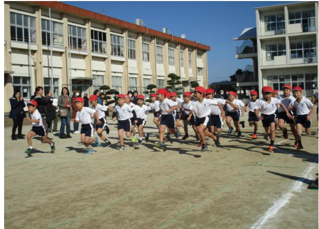
↑ 2年男子のスタート