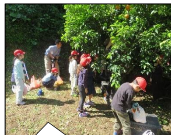
R6.4.25 に実施した2年生のミカン狩りの様子です。たくさん取れました！

東出水の豊かな自然の体験や地域の方々との温かい触れ合いを今後も深め、「東出水らしい教育」を充実させたいと思っておりますので、ご理解・ご協力をよろしくお願いいたします。