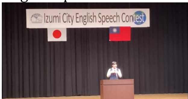
教科書を読んだ感想を英語でスピーチ