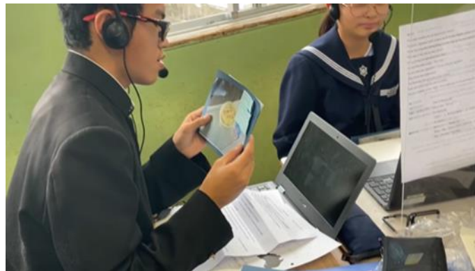
(William Ross State High School との交流)

ずっと楽しみにしていたオーストラリアとの交流授業でした。緊張したり、分からないこともあったりしたけど、自分なりにがんばりながら楽しめました。質問をし、相手が答えてくれたことはとても自信になった。もっといろんなことを話せるように英語の授業を頑張りたい。