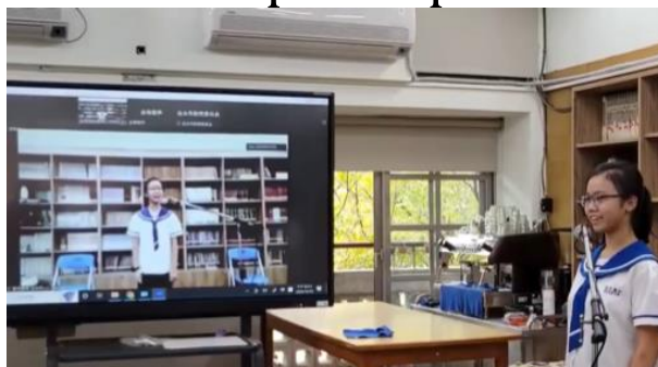
台湾広仁中からオンラインで参加する生徒

令和 4 年 10 月 18 日マルマエ音楽ホールでイングリッシュスピーチコンテストが開催されました。小学生が劇・プレゼン発表を英語で行い、中学 1 年生がベアスキット英語暗唱、 中学 2 年生が教科書の社会的な話題の英文を読んで、自分の意見を英語でスピーチ、中学校 3 年生は、自由課題で英語弁論、台湾の中学校から 2 人がオンラインで参加しました。(令和 5 年度は 11 月 8 日開催予定です。一般の方も参観できますので、ぜひ御観覧ください。)