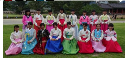
※写真は以前の交流事業の光景です。

だいかんみんこくスンチョン し 出水市は、大韓民国順天市との交流事業を平成24年度から実施しており、これに加え、令和6年度からは、 たいわんぷりーちん 台湾埔里鎮との交流も開始します。