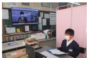
5年生の児童代表が新年の決意を立派に発表してくれました。