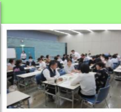
読書担当者等研修会