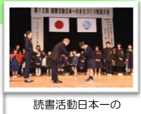
読書活動日本一のまちづくり推進大会