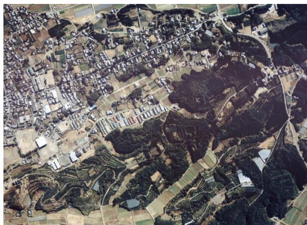
野田町上名の亀井山城跡

これら以外の中世山城跡は、遺構が良好に残っていても、その立地状況や環境・管理状況等によっては雑草・雑木等が繁茂して、大事な遺構を隠してしまい人目に付きにくくなっていることが多くみられるようです。最悪の場合、山城遺構の存在が忘れられてしまい、その結果、知らない間に工事などにより遺構が消えてしまうことが心配されます。