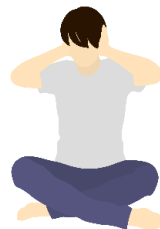
(令和4年出水市男女共同参画に関する市民意識調査より)