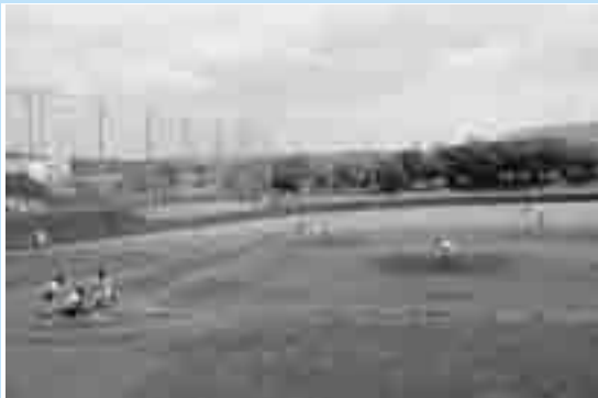
出水高校2年ぶりのV 市長旗杯

交流会では多くの帰郷者および市内在住者でふるさとの話で盛り上がっていました。また、本会から市内全小学校へドッジボールの寄付がありました。