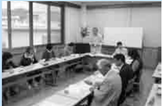
出水市NPOネットワークが発足 協力体制強化

大会中は天候にも恵まれ、保護者やOBなど多くの観客が、熱心に声援を送っていました。