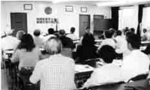
5月19日 地域安全モニター委嘱式および研修会