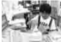
一日図書館員体験学習

中央図書館では、課題図書 の貸し出しも行います。読書感想文・感想画 に挑戦しませんか？