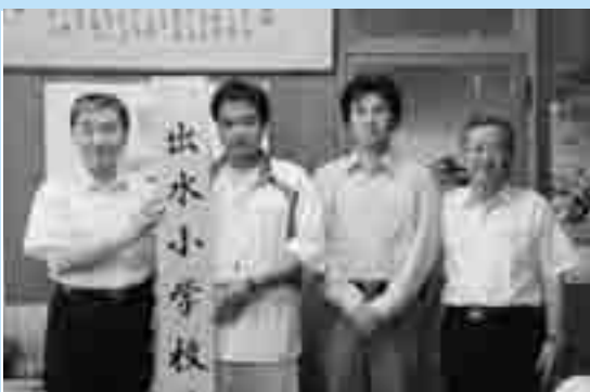
出水小へ寄付 出水V・B・C バレーボールクラブ

5月14日、出水市NPOネットワーク(矢野ミツ会長)が発足しました。出水市内複数のNPO法人が連携、協力し活動の拡大、質向上につなげようと、11のNPO法人が参加。発足総会では、今後の活動について意見交換し、来春3月の九州新幹線全線開業を控え、独自の開業イベントに取り組むことを確認しました。