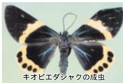
キオビエダシヤクの成虫