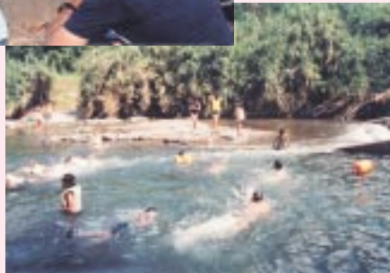
日焼けで真っ黒！ (川遊び)