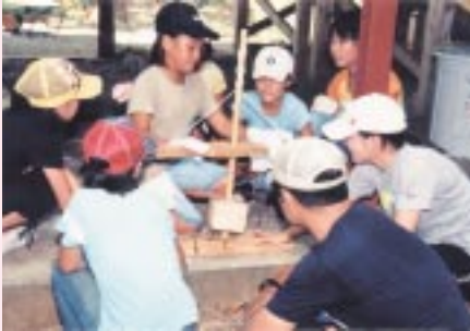
うまくつくかな？ (火おこし体験)

市内の小学4年生から6年生までの35人が参加。参加した児童は、キャンプをしながら野外冒険活動や野外炊飯、星座観察等で夏を満喫しました。