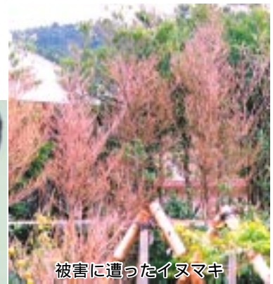
被害に遭ったイヌマキ