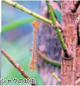
キオビエダシヤクの幼虫

自分で散布できない場合は、有料となりますが、出水市植木組合 ☎ ② 4884、出水地区緑化樹生産協議会 ☎ ② 8370、出水高尾野山林樹苗共同組合 ☎ ② 1493(にご相談ください)。