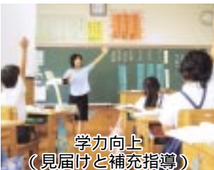
学力向上 (見届けと補充指導)

市指定「学力向上推進校」として、研究授業や教育実践を通して、子ども一人一人の読解力を向上させる指導について研究を推進しています。