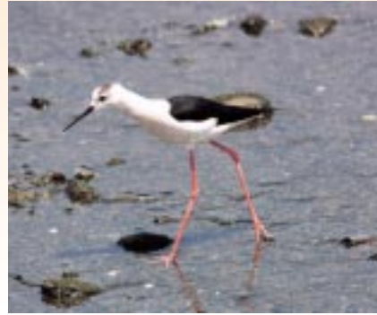
蛇淵川で今年4月に撮影

今月は、春と秋の渡りの時期に出水に立ち寄るセイタカシギです。海岸や河口の干潟、水田、河川などに生息しています。数羽で群れることが多い鳥です。