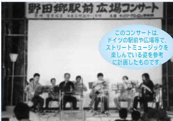
このコンサートは、ドイツの駅前や広場等で、ストリートミュージックを楽しんでいる姿を参考に計画したものです。