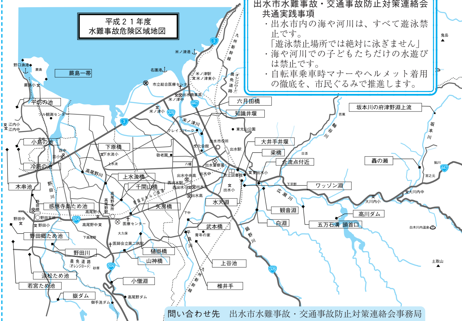
平成21年度 水難事故危険区域地図

問い合わせ先 出水市水難事故・交通事故防止対策連絡会事務局 (教育委員会学校教育課 ☎63-4079)