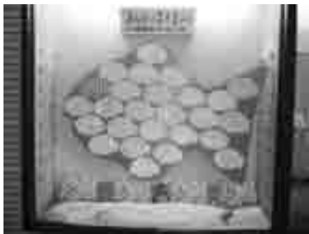
集まったスイミーたちが大きなスイミーになりました。

図書館では、集まったスイミーたちで絵本に出てくるような大きな魚を3匹作り、8月から出水中央、高尾野、野田図書館内で展示を行っております。この機会にぜひ近くの図書館まで足をお運びください。