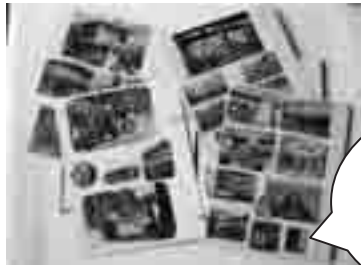
当時の街並みや 人物がたくさん 掲載されていま す。

市立図書館にはたくさん本がありますが、中には昔発行され、現在ではあまり見かけない懐かしい本や、市販されていない県からの寄贈資料など珍しい本もたくさん所蔵しています。