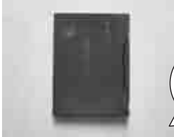
昭和33年発行 の「市役所落成記 念出水市写真帖」