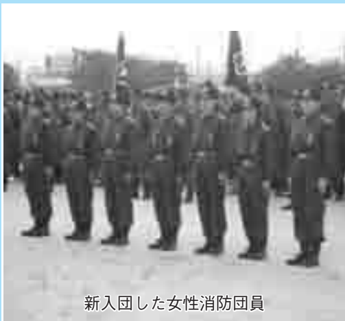
新入団した女性消防団員