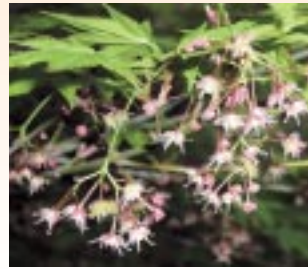
イロハモミジの花

モミジといえば、紅葉と書くように、山や庭園を美しく彩る「秋」を代表する植物ですが、「春」もモミジを楽しめます。4月から5月にかけて、若葉の間から小さい赤い房のようなものが見えてきます。これがモミジの花です。小さくて見落とす。