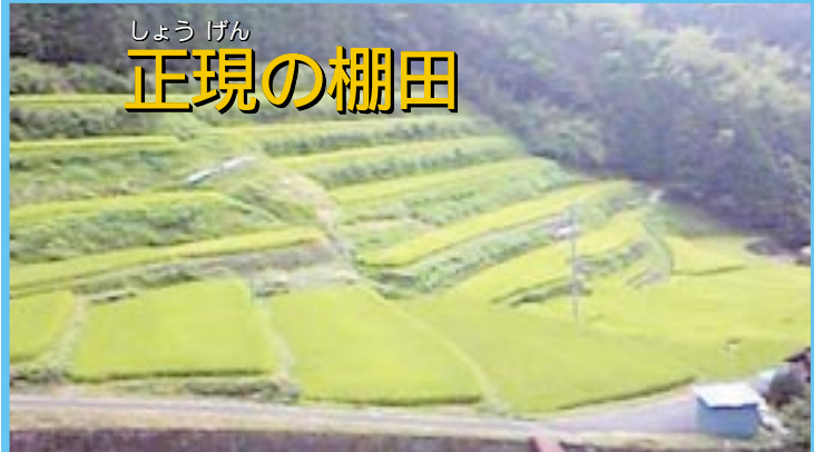
しょうげん 正現の棚田

樹齢1,300年、樹高12m、根まわり17.5mもあり、市の天然記念物に指定されています。蒲生の大楠との悲しい恋物語も残っています。