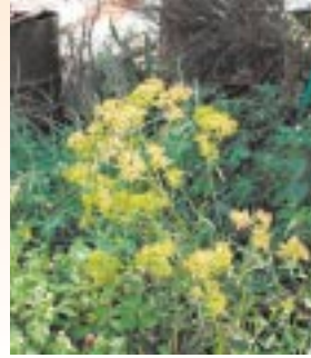
女郎花 (オミナエシ)

食べて無病息災を祝う春の七草。眺めて楽しむ秋の七草は、万葉集に出てくる秋の七草は、萩の花、尾花(ススキ)、葛花、撫子の花、女郎花、オミナエシ、藤袴、朝顔(あさがお)の七種ですが、ハギ、ススキ、クズ、オミナエシは、古くから薬としても利用されていました。風邪薬