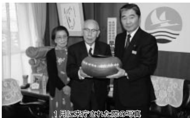
1月に来庁された際の写真