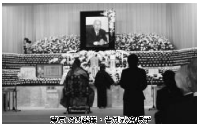
東京での葬儀・告別式の様子

平成元年の秋の叙勲で、勲一等瑞宝章を受章、平成13年には出水市名誉市民の称号を受けられました。