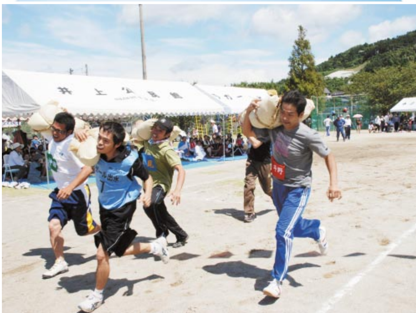
「地区別市民体育大会」東出水地区( 9月2日撮影 )