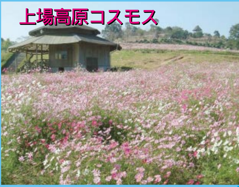
上場高原コスモス

今回は、上場高 原のコスモスを紹 介します。 広報いずみ3月 号掲載のお出か けマップもご活 用ください。