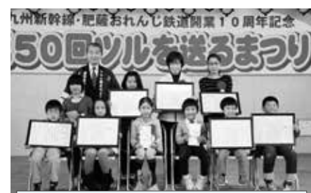
手作り絵本作りで表彰された皆さん

本市の誘致企業である同社は、1991年の本市進出以来、毎年、桜を寄贈されており、これまでに市内の公園など多くの施設に植栽され、市民の憩いの場となっています。