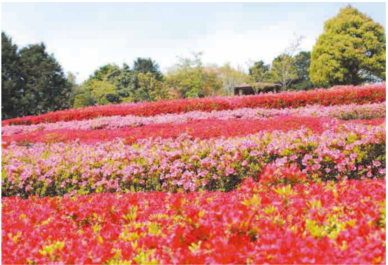
(出水市武本・兵児の森にて 4月9日撮影)