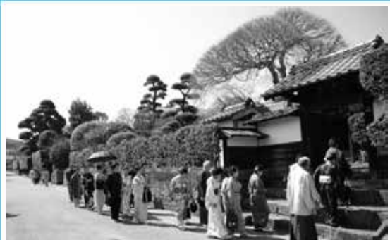
歴史を感じながら… 出水麓武家屋敷

新園舎は、鉄筋コンクリート平屋建てで保育室や遊戯室等のほか、新たにほふく室を設置するなど保育環境の充実が図られており、園児らは「みんなで仲良く遊べます。元気な姿をいつでも見に来てね。」とお礼を述べ、新園舎の完成を祝っていました。