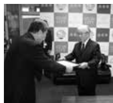
生涯学習・福祉・ボランティアフェスタで表彰された皆さん

受賞された皆さん、おめでとうございます。 2月22日に開催された「生涯学習・福祉・ボランティアフェスタ」において、出水市表彰および市社会福祉協議会表彰が行われました。また、3月15日に開催された、「第50回ツルを送るまつり」において、手作り絵本づくり表彰が行われ、同30日に開催された「ありがとう祭り」では手作り絵本の紹介が行われました。表彰を受けられた皆さんおめでとうございます。