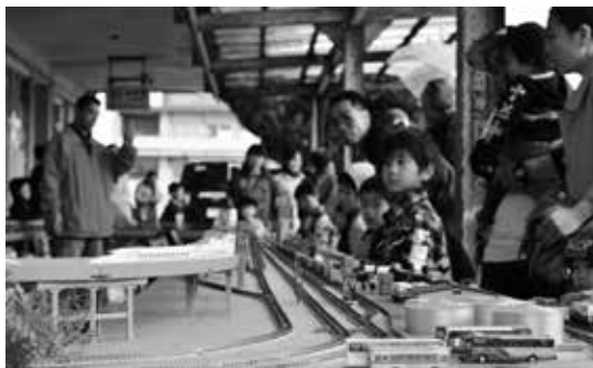
ありがとう！10周年 肥薩おれんじ鉄道

3月30日、肥薩おれんじ鉄道の開業10周年を記念した「ありがとう祭り」が出水駅前芝生広場で開催されました。会場内には、Nゲージ（鉄道模型）の展示や物産展のブース等が設置され、特設ステージでは手作り絵本の紹介などがあり、多くの子ども連れが集まっていました。また、8日に東出水小学校の児童が車両に将来の夢を描いたペイント車両が、ペイントした児童たちを乗せ初走行しました。