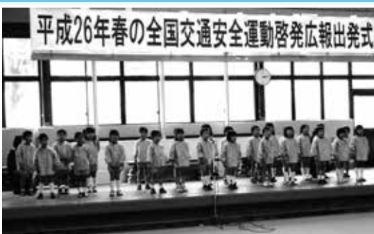
心に余裕のある運転を 春の全国交通安全運動

曇り空を吹き飛ばすような迫力ある太鼓演奏やダンスパフォーマンス等もあり、祭りに華を添えていました。