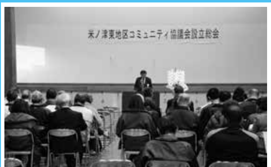
コミュニティ協議会設立 米ノ津東地区

県の担当者から、農場の立ち入り検査の状況や症状の報告があり、あらためて施設の点検・消毒や家畜の観察など農家への指導を徹底することなどを確認しました。