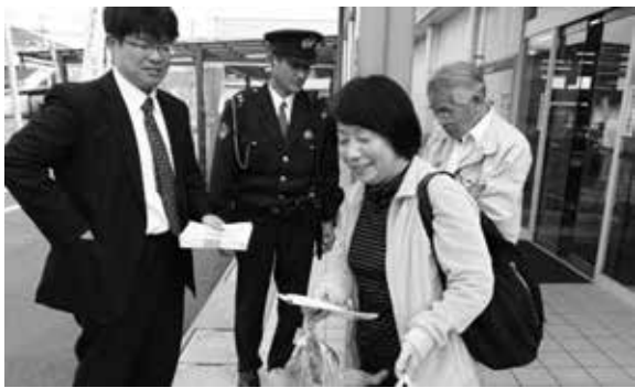
犯罪防止のチラシを受け取る来店者

防犯協会では、4月6日（日）～同15日（火）の10日間、出水警察署と連携して春の地域安全運動を実施しました。