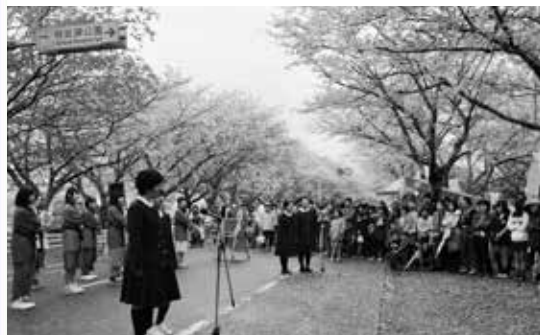
満開の桜の下で いずみ桜まつり

3月30日、肥薩おれんじ鉄道の開業10周年を記念した「ありがとう祭り」が出水駅前芝生広場で開催されました。会場内には、Nゲージ（鉄道模型）の展示や物産展のブース等が設置され、特設ステージでは手作り絵本の紹介などがあり、多くの子ども連れが集まっていました。また、8日に東出水小学校の児童が車両に将来の夢を描いたペイント車両が、ペイントした児童たちを乗せ初走行しました。