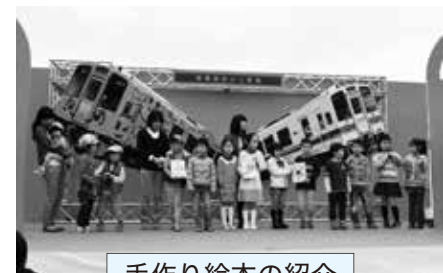
手作り絵本の紹介