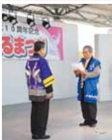
ツル観察センター設置の募金箱に集まった善意を、ツル保護会に寄付していただきました。

Siセンサー（温度センサー付き） コンロを寄付された、鹿児島県LPガス協会の皆さん。