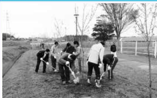
桜を寄贈 大豊工業

式では、出水保育園の園児らが「車を運転する時は、思いやり運転をお願いします。」と元気よく交通安全宣言を行いました。