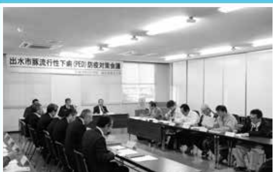
防疫体制について確認 豚流行性下痢対策会議

当日は晴天に恵まれ、多くの参加者が色とりどりの着物に身を包み、歴史ある町並みを眺めながら散策を楽しんでいました。