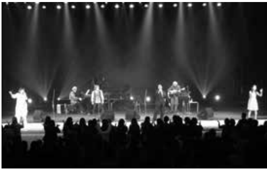
心に残る名曲の数々 フォーエバー・メモリーズ・コンサート

3月1日、文化会館において、市自主文化事業「フォーエバー・メモリーズ・コンサート」が開催されました。