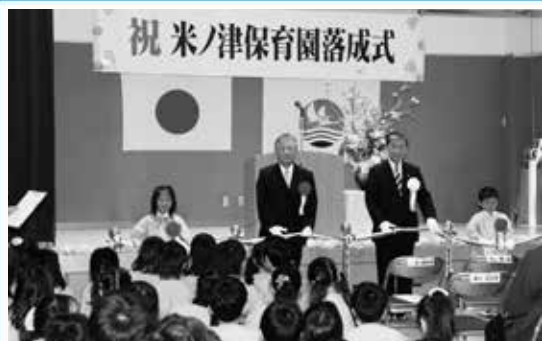
新しい学び舎 米ノ津保育園

通信指令施設は、市内で発生する火災や救急等の緊急情報を受信し、迅速で的確な活動を指示するための機器で、多様化する通信網(携帯電話等)からの緊急通報や電波法の改正による消防無線のデジタル化に対応するため今回更新されました。新指令施設の導入により、通報地点・災害地点をより迅速に特定し、指令を発することが可能となりました。