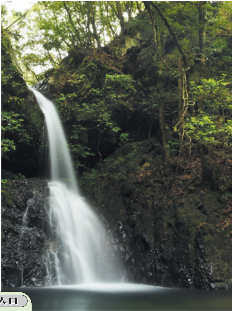
御手洗川の上流にて(6月7日撮影)