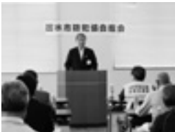
渋谷会長のあいさつ

会議では、2013年度の活動経過、決算等の報告、承認の後、2014年度の活動計画、予算および新役員等について審議され、決定しました。