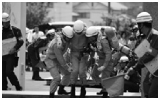
県代表として全国へ 救助訓練競技大会

市では、引き続き市民の安全安心のため、関係機関と連携を取りながら、防災意識の啓発や、危険箇所の防災対策を推進していきます。