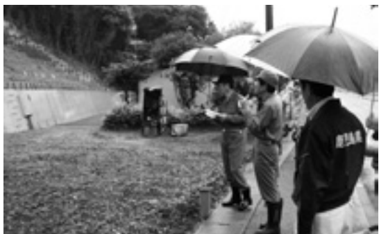
危険箇所をチェック 関係機関合同点検

6月10日、梅雨の大雨や台風への備え、がけ崩れ等災害の恐れのある、市内4カ所の災害危険箇所の現場確認を、市、県、消防、警察合同で実施しました。