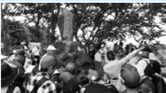
郷土の史跡を訪ねて 史跡めぐりウォーク

5月18日、先人が遺した郷土の歴史にふれようと史跡めぐり歩こう大会が野田地区を中心に開催されました。当日は天候に恵まれ、感応寺や木牟礼城跡など中世島津家に関する史跡を巡る約7キロのコースに、子ども連れなど100人を超える多くの市民が参加しました。