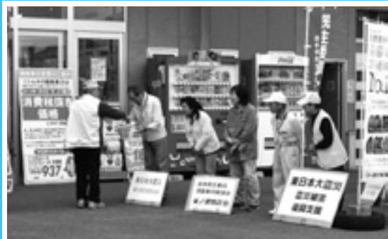
善意を被災地へ 民生委員・児童委員

参加者は、それぞれの史跡で説明を受けながら、郷土の史跡に直に触れる良い機会となりました。来年度は、高尾野地区で開催予定です。