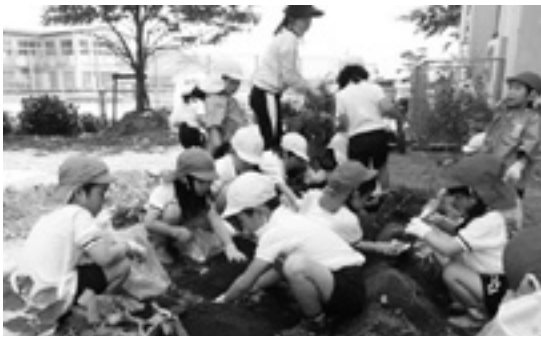
たくさん穫れたく！ 幼少合同じゃがいも掘り

荘小学校1年生6人と附属幼稚園児16人が、5月8日、校内にある学習農園でじゃがいも掘りをしました。1月に幼小合同で植えたじゃがいもの収穫で、幼小連携学習の一環として行われました。