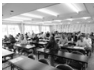
モニターの皆さん