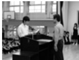
宣言を読み上げる生徒代表

警察では、市内の中学校、高校の中から毎年1校を「自転車盗難防止モデル校」に指定しており、今年は出水中学校が指定されました。