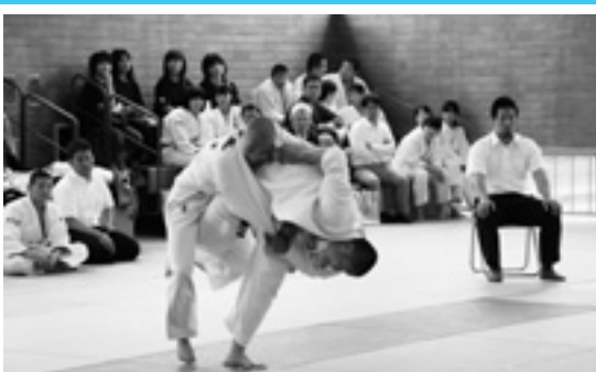
一本! 北薩中学校柔道大会

集まった多くの募金は社会福祉協議会を通じて、被災地に贈られました。ご協力いただいた皆さまありがとうございました。