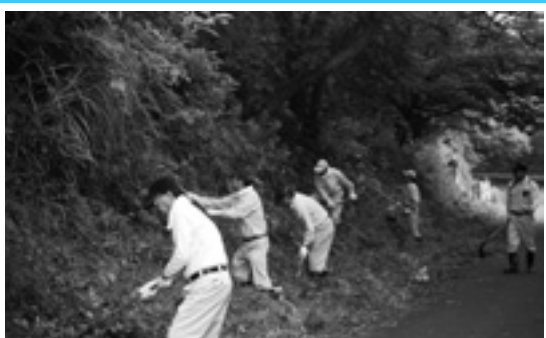
水源の森づくり 東光山下刈りボランティア

古田隊は、優勝タイムも早く、8月27日千葉県で開催される全国大会での活躍が期待されます。