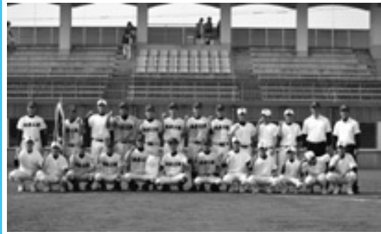
10年ぶりの栄冠 市長旗争奪野球大会

1年生がじゃがいもの掘り方の手本を見せたあと、園児と1年生がペアになって掘り、じゃがいもが出てくると「あった!」と歓声を上げながら、嬉しそうに手にとり、一つ一つ大事に袋に入れていました。