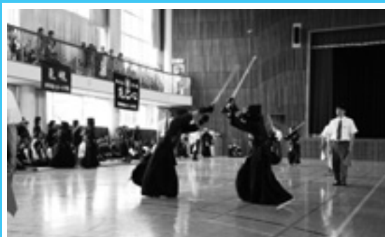
剣は心なり 少年剣道練成大会

会場には、家族や仲間も応援にかけつけ、多くの声援のなか豪快な投げ技で一本を取ったり、中学生とは思えない巧みな技の応酬が見られるなど、日ごろの練習の成果を十分に発揮した熱戦が繰り広げられていました。