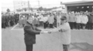
渋谷防犯協会長が山鹿大川内防犯パトロール隊長に燃料費を贈呈

出水警察署において防犯関係者、交通安全関係者、警察署員等約150人が参加し、実施されました。