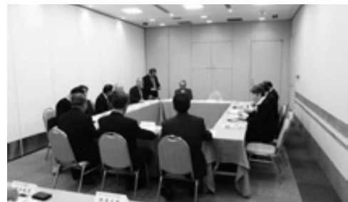
ふるさと大使首都圏会議