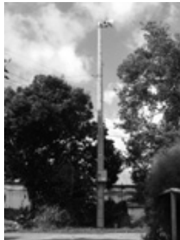
古浜自治会 屋外放送設備②