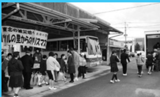
福島へプレゼント 市内小中高校

東日本大震災の被災地へ「ツルの里からのクリスマスプレゼント」として支援物資が送られ12月5日、市役所で出発式がありました。