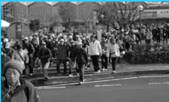
ツル見上げて歩く ツルウォーキング