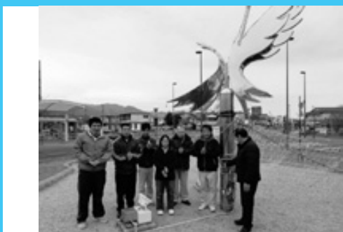
駅前が鮮やか イルミネーション

午前9時35分の始発からほぼ1時間おきに1日往復6便で、2月末まで運行します。終日乗降できる1日周遊プランは大人1000円、小学生500円(未就学児は無料)。また、要望があれば特産館いずみや箱崎八幡神社で途中下車もできます。