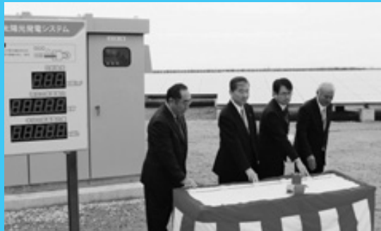
クリーンエネルギー メガソーラー稼働

間近でツルが舞うツル観察センターまで歩く約14キロのAコースと、米ノ津川周辺の野鳥のさえずりを聴きながら出水駅を発着する約7キロのBコースがあり、市内外から約300人が参加し冬晴れの下で心地よい汗を流していました。参加者に特産品などが当たる抽選会もありました。