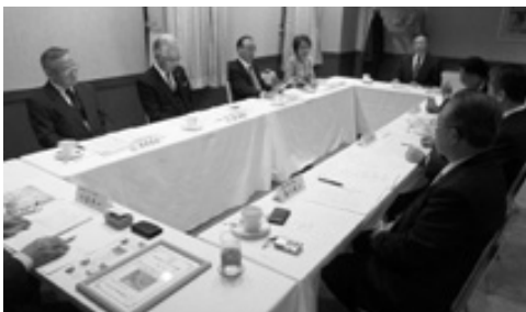
ふるさと大使福岡会議