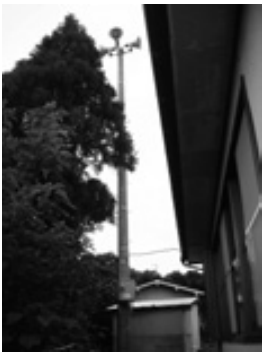
旧番所自治会 屋外放送設備