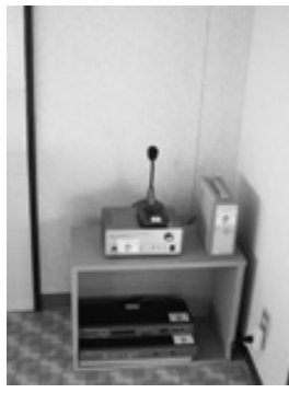
旧番所自治会 基地局