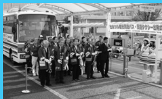
ツル周遊バス運行 出水駅発着

小規模校は伊唐魂ブリッジ(伊唐小)、3・4年生は米東ビクトリー1(米ノ津東小)、5・6年生はKFC熱勝42?(出水小)が制しました。