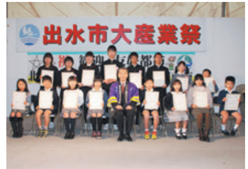
賞状を手にする受賞者の皆さん