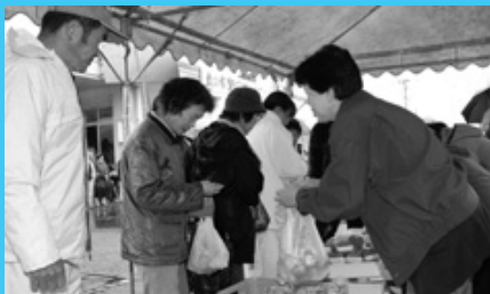
野田の味集合 野田郷むらまつり

事故を起こし出火した車に初期消火を行った後、自動車内に取り残された人を油圧カッターを使って救助するなど、緊迫した雰囲気の中で迅速に作業がなされていました。