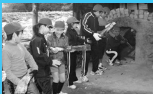
地域の文化を体験 大川内小

一般男子は川薩陸協A、高校生男子は鶴翔A、中学生男子は鶴田中学校A、中学生女子は谷山中学校、小学生男子は隼人ジュニア陸上スポーツ少年団A、小学生女子は松高陸上クラブAが制しました。