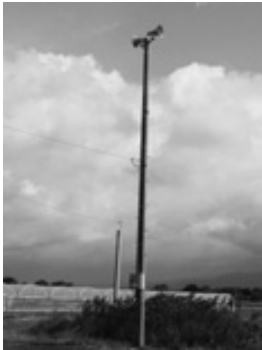
古浜自治会 屋外放送設備①