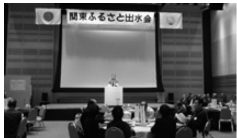
関東ふるさと出水会総会