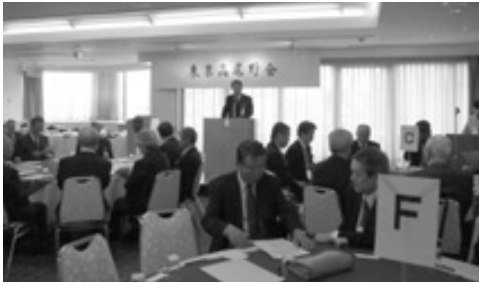
東京高尾野会総会