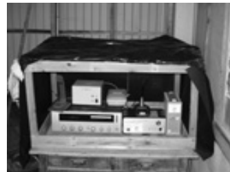
古浜自治会 基地局