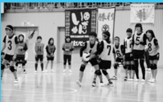
おれんじカップ 小学生の大熱戦!

式では、市長をはじめ関係者らが発送電スイッチを押して、新たな発電所の稼働を祝いました。