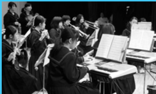
芸術の秋 出水市文化祭

前日には研修会などもあり、試合での判定技術向上のための講習や、長年にわたる審判員の功績を認められた方への表彰もありました。