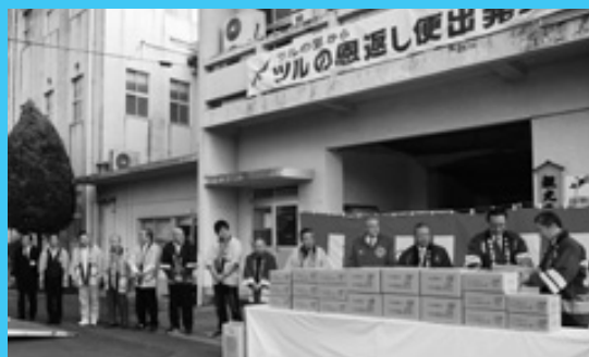
ツルの里からあの人へ ツルの恩返し便

出水の特産品詰め合わせ「ツルの恩返し便」の出発式が12月7日、市役所であり、初便812セットが全国に発送されました。