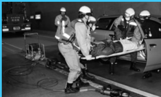
連携を確認 トンネル防災訓練

全長2605m、県内3番目に長い国道504号高尾野トンネルで12月4日、同トンネル内での事故を想定した訓練がありました。