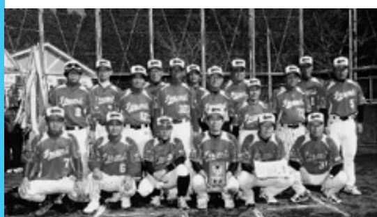
出水支部6連覇 ソフトボール

11月18日、鹿屋市で開催された第39回鹿児島県ソフトボール協会支部対抗ソフトボール大会で出水支部が6連覇を達成しました。