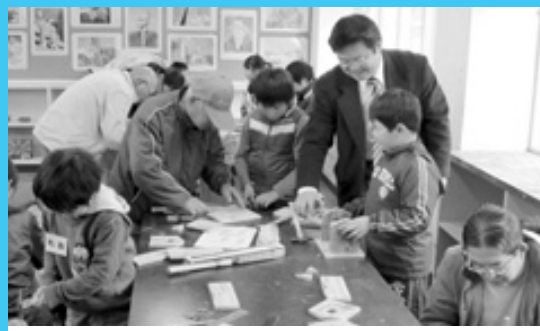
大川内小において 特認校体験

点灯は1月15日までで、時間は午後5時30分から同11時40分まで。JR、肥薩おれんじ鉄道の最終便到着まで楽しめます。