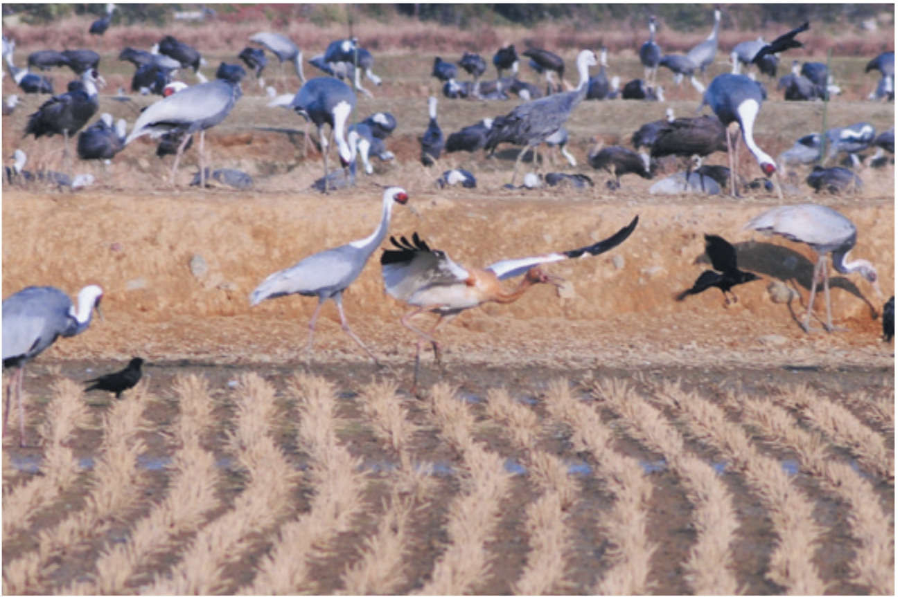
(荒崎休遊地にて12月7日撮影)