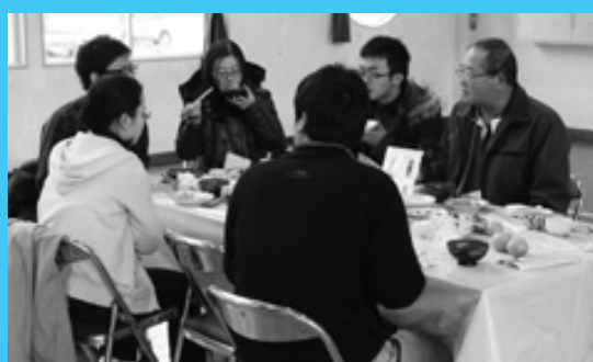
国際交流楽しむ 鹿大留学生

各校代表の児童生徒らはメッセージを読み上げた後、手分けしてトラックに積み込みました。