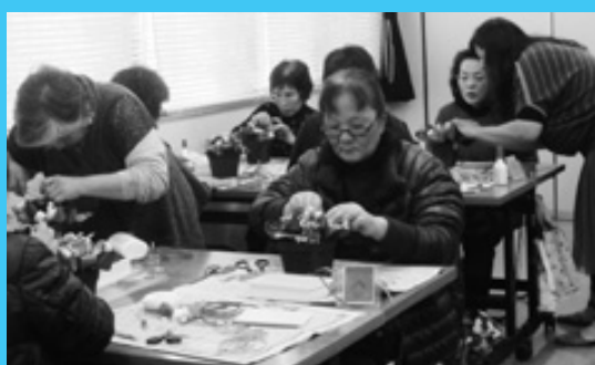
夢中になる楽しさ 働く婦人の家講座

留学生らは武家屋敷群やツルを見学し出水の観光を楽しみ、地元女性グループの手作り料理に舌鼓を打ちながら農水商工業者との情報交換を行いました。