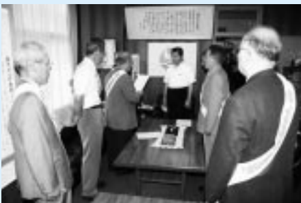
6月30日、出水保護区保護司会の役員7人が、この運動への理解と協力を求める法務大臣と鹿児島県知事のメッセージを、渋谷市長に手渡しました。